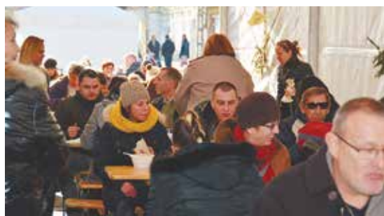
Közös ebéd a Kossuth Lajos utcában