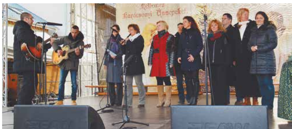
Színpadon a helyi általános iskolák és civil szervezetek művészeti csoportjai, valamint a Sziget Színház