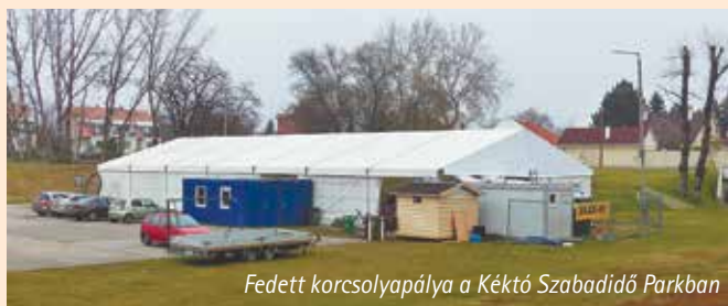
Fedett korcsolyapálya a Kéktó Szabadidő Parkban

A Szigetszentmiklósi Önkormányzat idén is biztosítja a lakosság, valamint az óvodai és iskolai csoportok részére az 500 m 2 alapterületű jégpálya használatát a Kéktó Szabadidő Parkban.