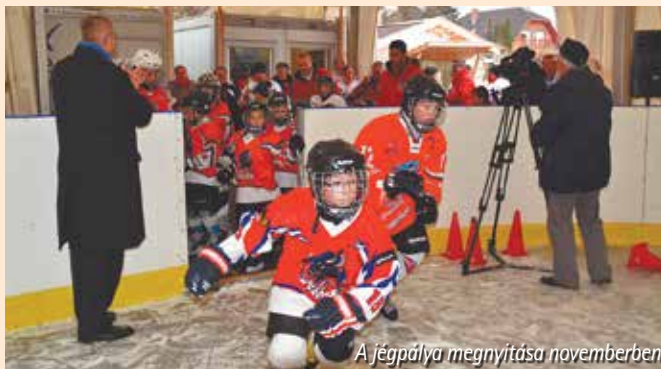
A jégpálya megnyitása novemberben

20.30–22.00-ig a teljes pálya bérelhető (térítés ellenében)