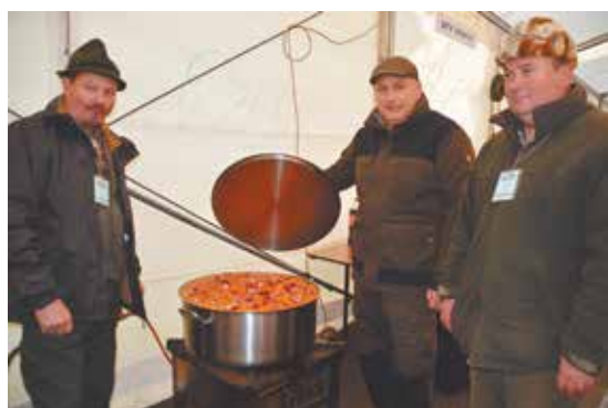
Fő a Vadásztársaság töltött káposztája