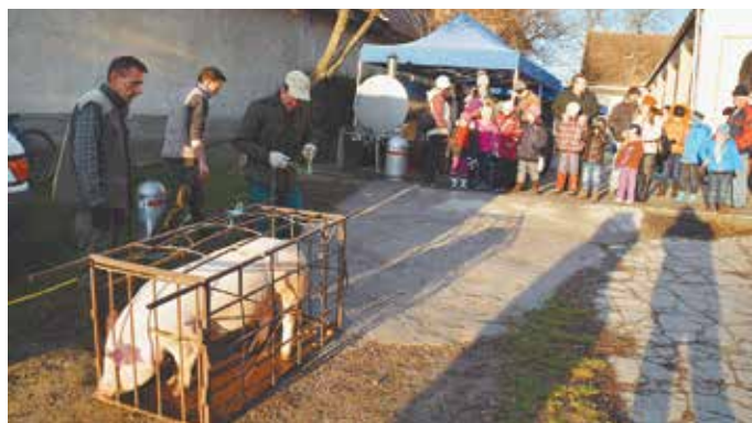
Disznóvágás a Buga iskola udvarán