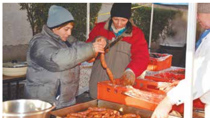
Készül a disznótoros