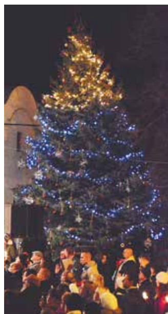
A város karácsonyfája