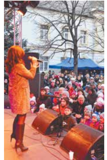
Az Adventi Vasárnap sztárvendége az EMerTon-díjas ZSÉDA