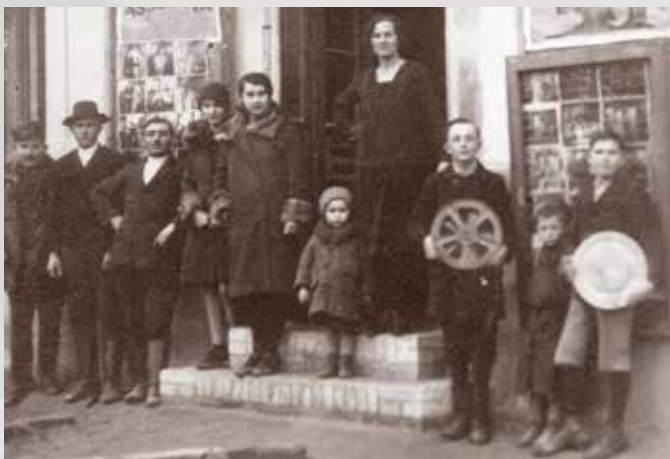
A Kerekes-mozi bejárata