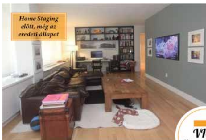
Home Staging előtt, még az eredeti állapot

Üdvözöllek az eladásra felkészített ingatlanok világában! „...mert a Te házad is lehet valaki Álomháza”