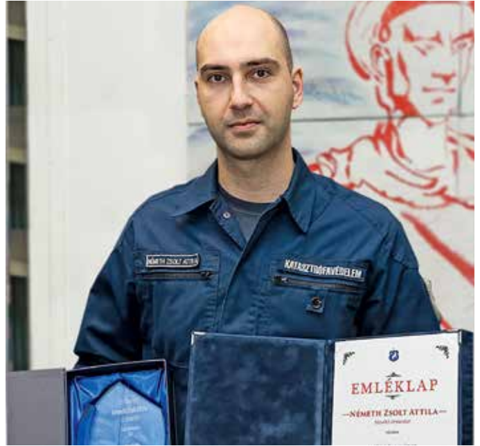
„Szigetszentmiklós Város Év Tűzoltója 2022”

Folyamatosan részt vesz az új kollégák betanításában, melyet saját munkája maradéktalan ellátása mellett hajt végre. Túlnyomórészt a kiemelkedő súlyú, bonyolult megítélésű bűnügyek vizsgálatát végzi. Az elkövetők felelősségre vonását szívügyének tekinti. A Vizsgálati Osztály beosztottjait szakmai tudásával támogatja, a felmerülő szakmai problémák megoldásában aktívan részt vesz. Az eltelt mintegy 28 évben mutatott hozzáállásával, teljesítményével példaértékű az egész állomány számára.