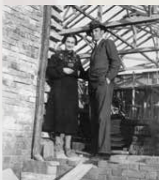
A mozi építése