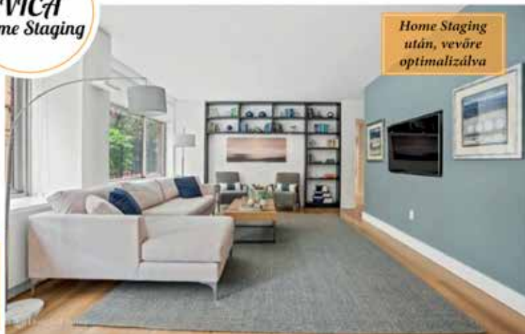
Home Staging után, vevőre optimalizálva

Az ingatlan felkészítésre befektetésként kell tekinteni!