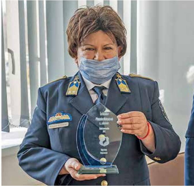
„Szigetszentmiklós Város Év Rendőre 2022”