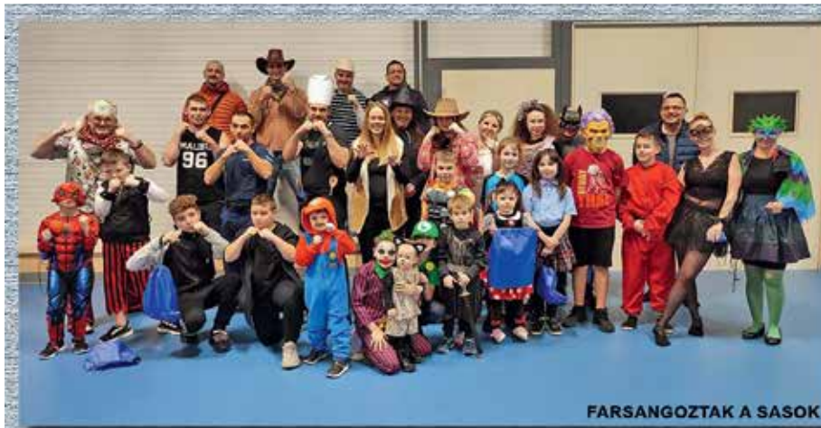
FARSANGOZTAK A SASOK