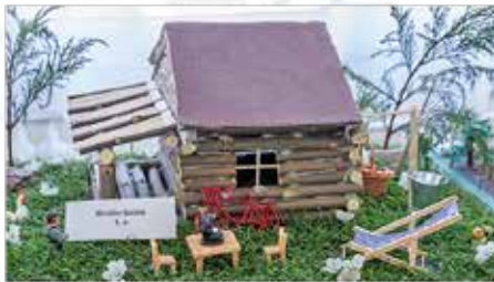
I. hely: Winkler Szilárd