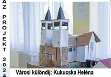
Városi különdíj: Kukucska Heléna