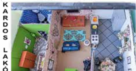
Különdíj: Pelyvás András