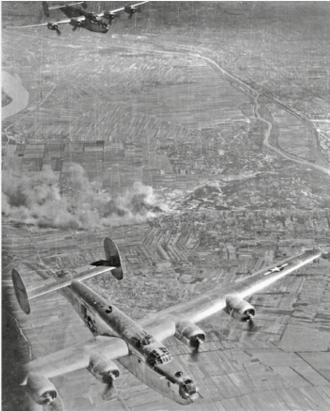
A Repülőgépgyárat támadó B-24 Liberator gépek a Csepel-sziget fölött.