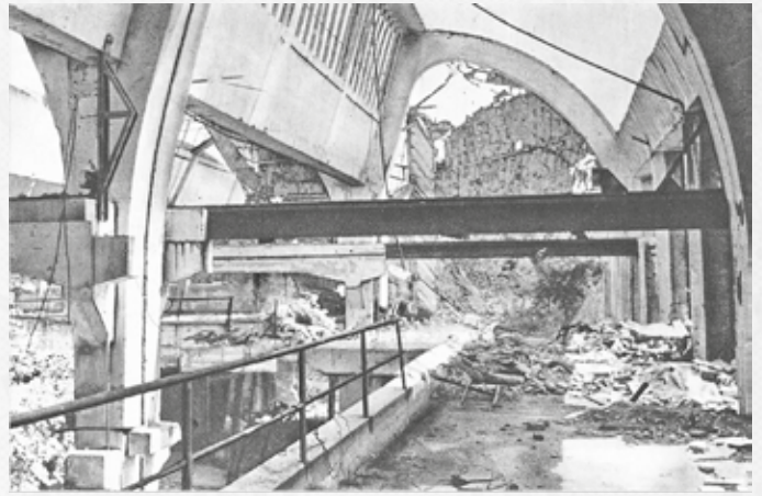
A Dunai Repülőgépgyár romos épületei.

Idén áprilisban 80 éve, hogy lezajlott a Szigetszentmiklós határában álló Dunai Repülőgépgyár bombázása. Az 1944-ben a szövetséges bombázók által elkövetett pusztításnak a sok halott mellett az lett a következménye, hogy a Messerschmitt zuhanóbombázók gyártását a Kőbányai pincerendszerbe költöztették, és a Dunai Repülőgépgyár romos épületei évekig elhanyagoltan heverték.