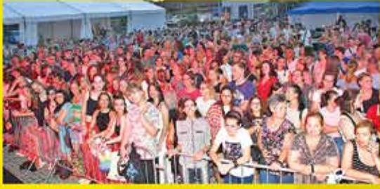
KLÁRSÓK MESEKONCERT (08:198)