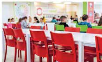
Fotó: 2023-ban felújított dombóvári étkezők egyiké.

Lajos Általános Iskolában, valamint a Kardos István Általános Iskola és Gimnáziumban is.