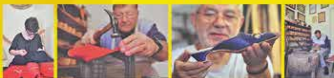
Részlet az Aula Galéria tártatóból. A kiállított fotókat Frank Yvette készítette.

Tudták, hogy egy szegedi templomban Szűz Mária lábain is nemzeti értékünk, a „szegedi papucs ékeskedik”?