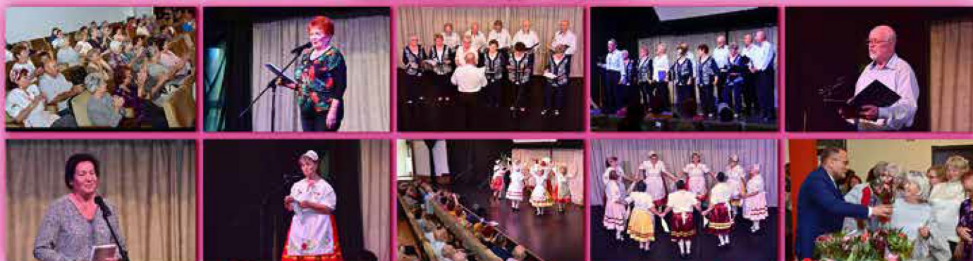
Őszirózsa Nyugdíjasklub anyák napi rendezvénye - május 7.