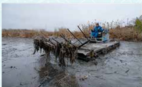
Fotó: Romet Róbert