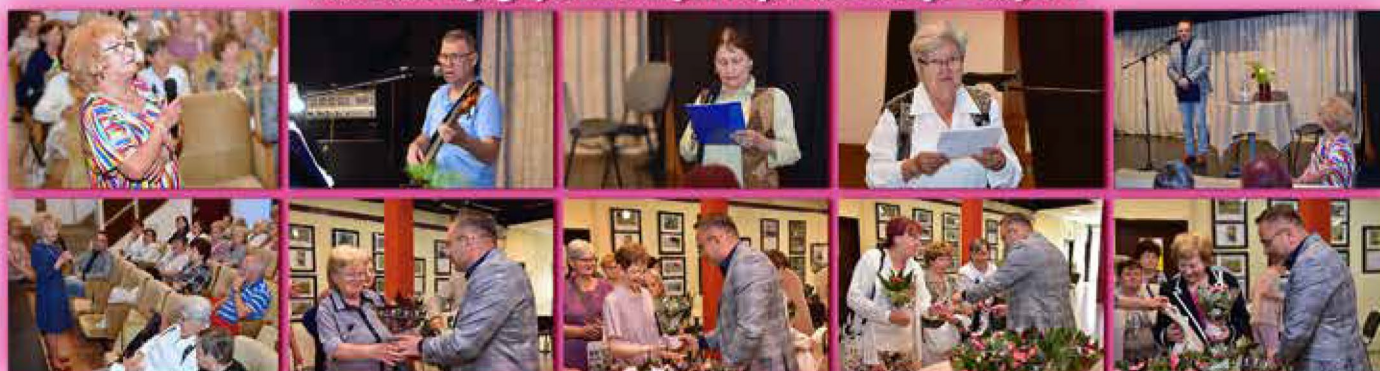
Lillaakác Nyugdíjasklub anyák napi rendezvénye - május 15.