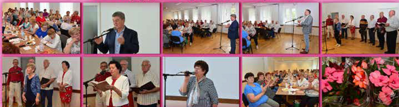
Német Nemzetiségi Önkormányzat anyák napi rendezvénye - május 16.