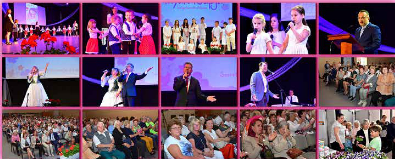
Városi Anyák Napja - május 6.