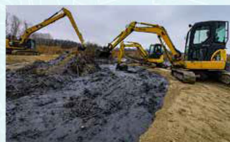
Fotó: Romet Róbert