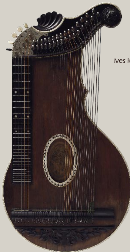
Perfekta íves koncert citera