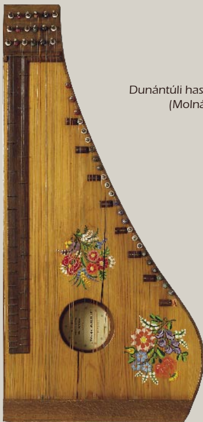
Dunántúli hasas tenor citera (Molnár Imre - Molci)