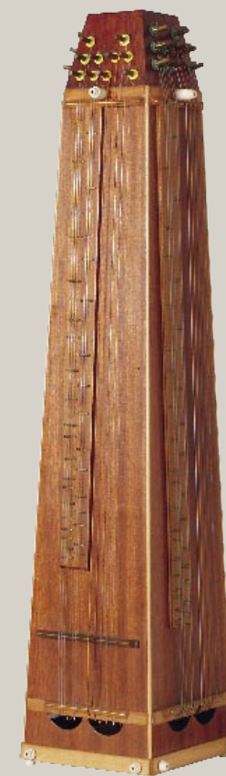
Négy oldalról játszható toronycitera (Molnár Imre - Molci)

Budapest déli szomszédságában elterülő Szigetszentmiklóson található Magyarország leggazdagabb citeragyűjteménye. A gyűjtemény a XIX. század elejétől napjainkig követi a falusi emberek készítette legelterjedtebb magyar népi hangszer alaki változásait. A mintegy 150 darabból álló kiállítás egyedi a maga nemében. Minden képzeletet felülmúló formagazdagsággal találkozhat itt az idelátogató érdeklődő!