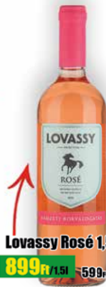
Lovassy Rosé 1,5l