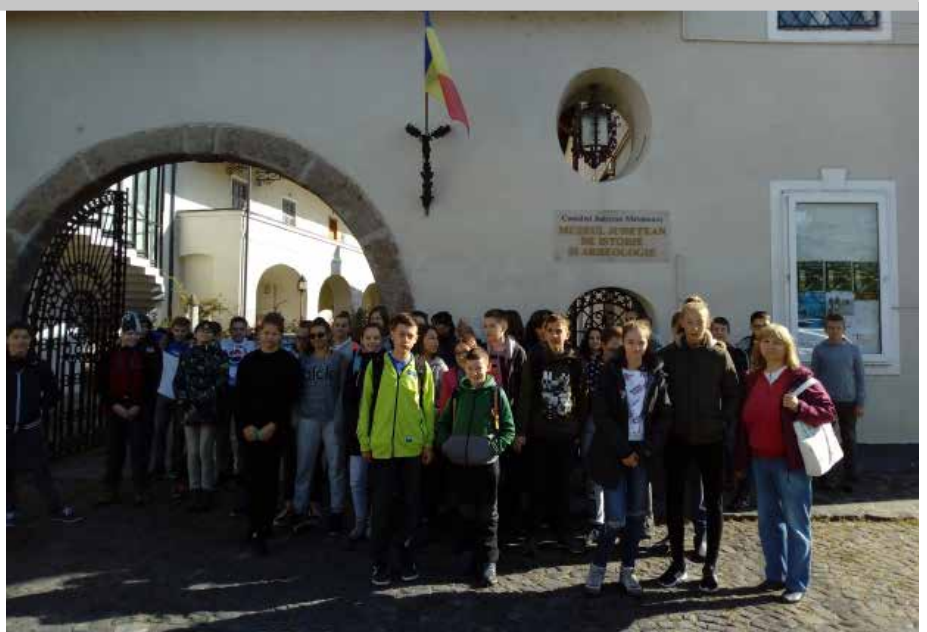
Nagybányán a Pénzverde épülete előtt

A „Nyitott szemmel a Máramarosban” program fő célkitűzése az iskola névadójának szülőházána felkeresése Tasnádon, a településen található iskolával való kapcsolat felvétele mellett pedig a térség megismerése volt. Jártak Erdődön a várban, Szaploncán a Vidám temetőben, Nagybányán a Pénzverdeben, Ásványtani Múzeumban. Deszén a Paraszkiwa-templom mindenkit ámulatba ejtett. A zsigó Wesselényi-kastély, Kölcsey Ferenc és Ady Endre szülőháza, Kismajtény faluban a Szatmári békekötés emlékoszlopa maradandó emlékek. Október 6-án Szatmárnémetiben együtt emlékeztek a helyiekkel az Aradi vértanúkra. Igazi ereklyével tértek