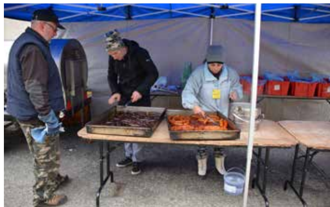
Hurka- és kolbászsütés