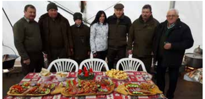
A Vadásztársaság vendéglátása