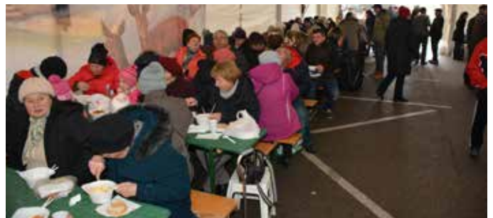
Közös ebéd a nagysátorban