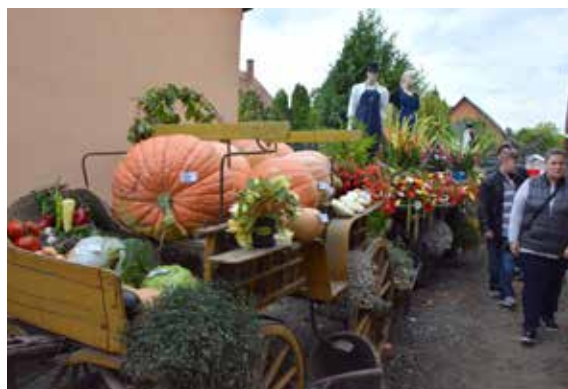
A Kossuth Kertbarát Kör terménybemutatója