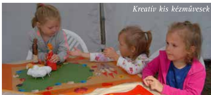
Kreatív kis kézművesek