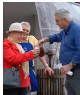
Mustkóstoló a polgármestertől