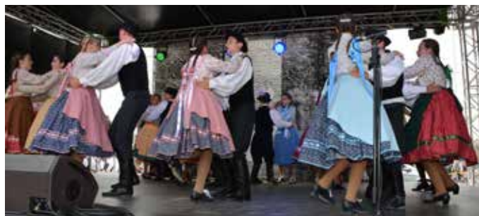
Szabacsi mustra, avagy a művészeti csoportok bemutatkozása