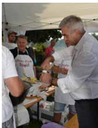
Mindennek alapja a jó hangulat