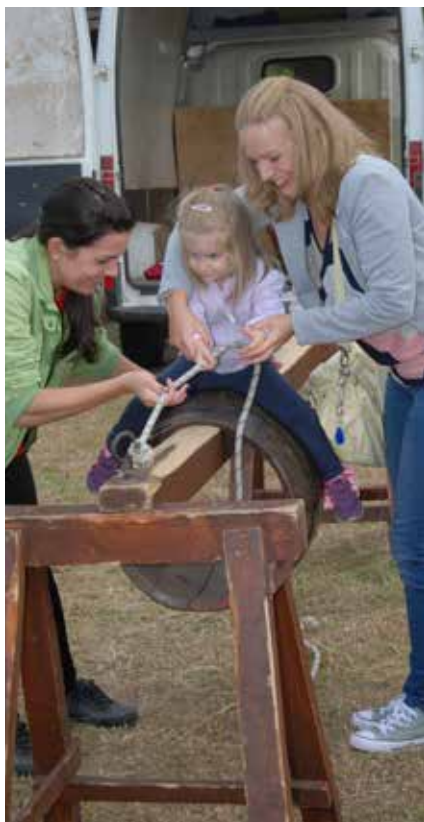
A népi játékok udvarában