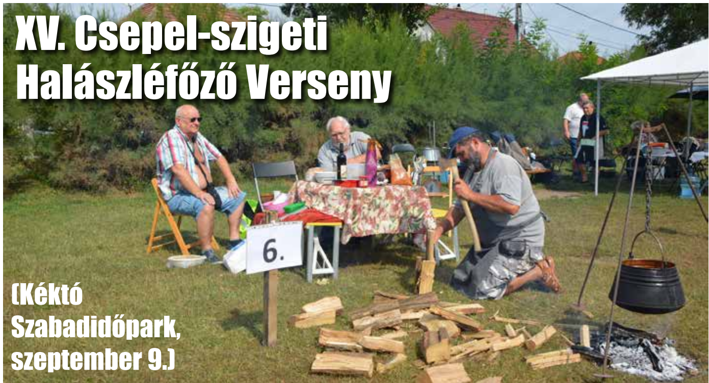
A halászlé a tűzifával kezdődik