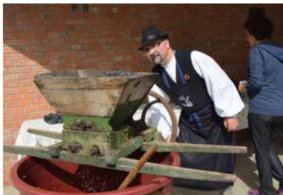
Készül a must