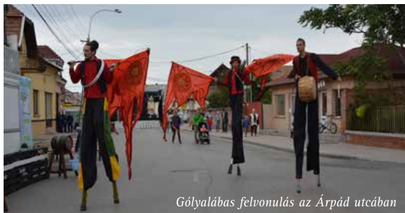
Gólyalábas felvonulás az Árpád utcában