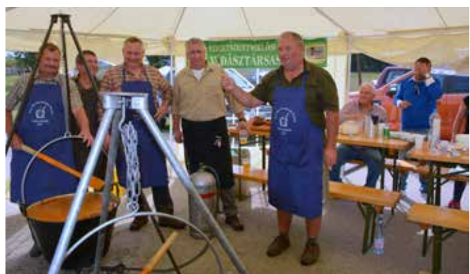
A vadásztársaság halászleve minden évben kiváló