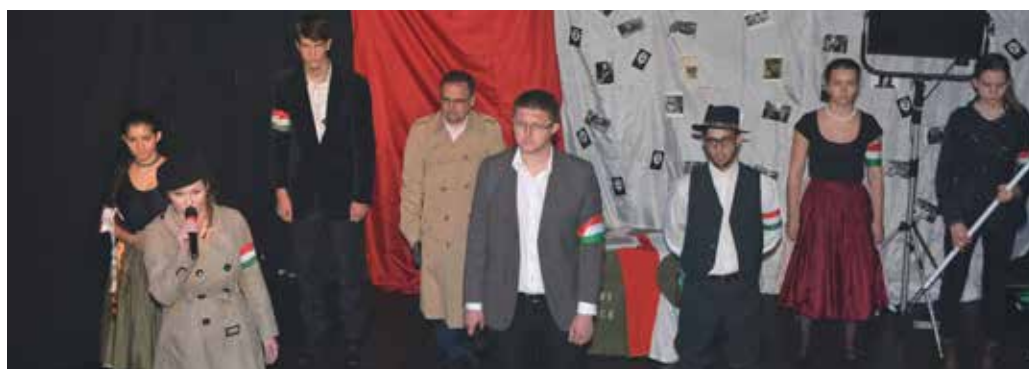
Ünnepi műsor a Sárospataki Magyar Ifjak a Közösségvállalásért művészeti csoport előadásában

Készülődés – várakozás – izgalom – Őszi kánon – Corvin közí ballada – Túlélők – Ifjúság, Te vagy a csillagunk – Indul a pesti tüntetés – Mennyből az angyal – Miért hagytuk, hogy így legyen... csak néhány cím az elhangzottakból. Szavak, színek, képek, dallamok, érzések... '56-ról sokan írtak, sokat hallottunk, de még mindig titokzatos, fájdalmas, megrendítő az emlékezés. Mi így tiszteltük a hősök előtt.