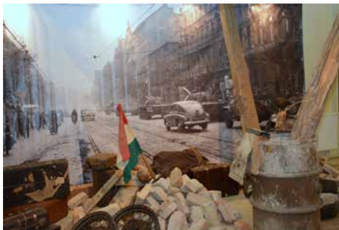
A forradalom napjait idéző kiállítás a Városi Könyvtár és Közösségi Ház aulájában