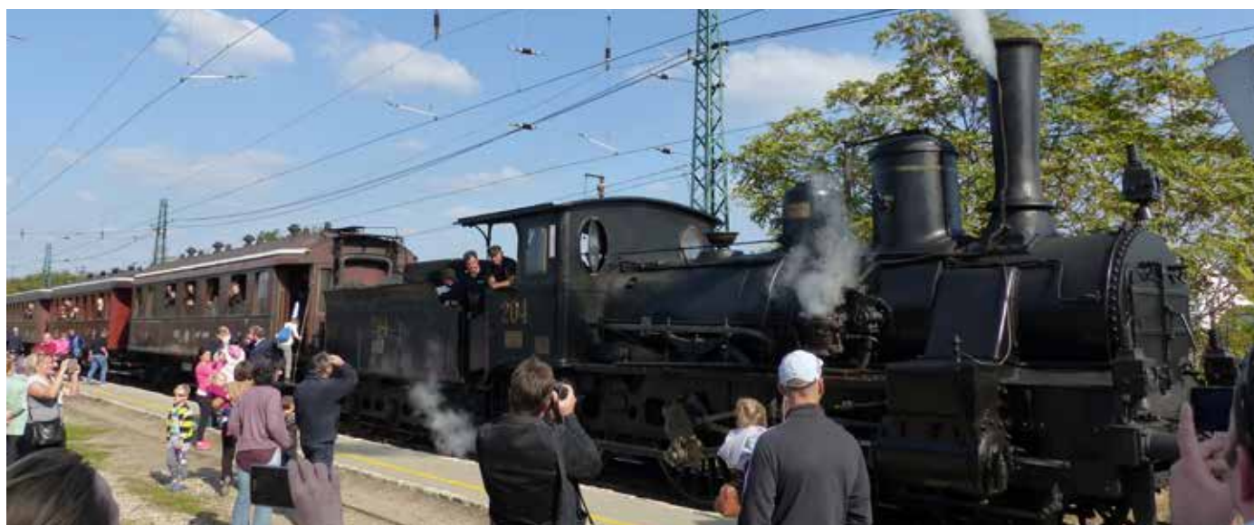
Nosztalgiajvonat az első Helyi Érdeklő Vasút átadásának 130. évfordulója alkalmából a Ráckevei HÉV vonalán (2017. szeptember 30.)