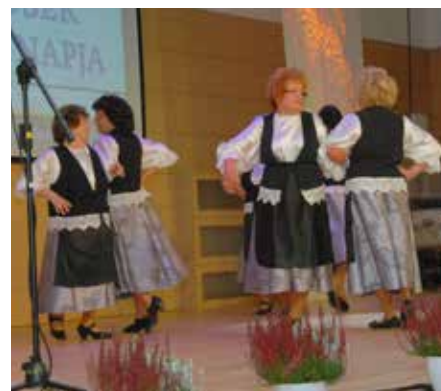
Az ünnepi műsorban felléptek a város nyugdíjas klubjainak művészeti csoportjai

kesnek, ha az idő előrehaladtával saját utódainknak egy értékesebb világot tudunk átadni. A polgármester egyúttal megköszönte az idősek sok évtizedes munkáját, amellyel szebbé, élhetőbbé tették városunkat, tapasztalataikkal pedig segítették a felnövekvő generációk életét.