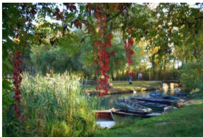
Pihenő csónakok az őszi Kis-Dunán

Kellemes korcsolyázást és jó szórakozást kívánunk!