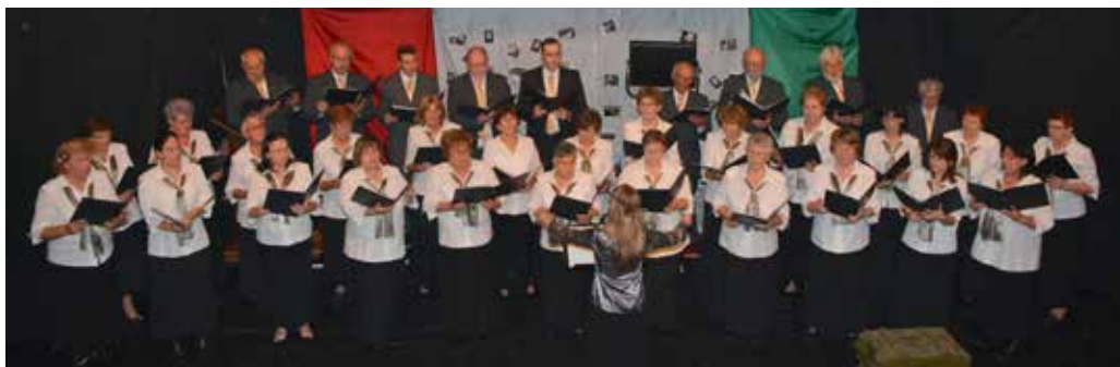
A Székely Miklós Városi Kórus előadása a színházteremben