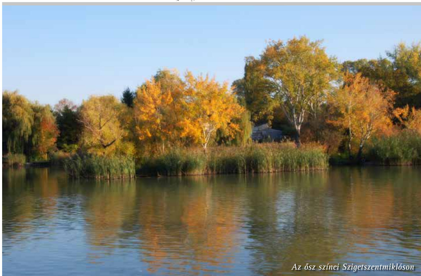
Az ősz színei Szigetszentmiklóson