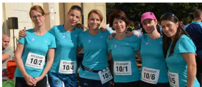
A Polgármesteri Hivatal csapata

Idén 11. alkalommal rendezték meg a sportnapot az ÁTI-Sziget Ipari Park területén. A hagyományos váltófutás és a gyermekeknek szervezett futóverseny idén is számos érdeklődőt vonzott, akik jó időben sportolhattak a szabadban.