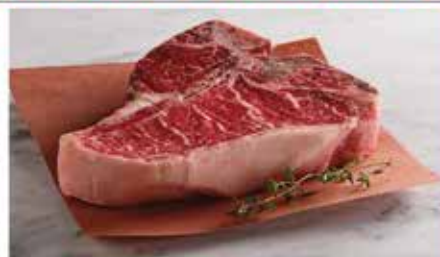
Porterhouse Steak 9990Ft/kg, kb 45 dekásak a szeletek

Ez egy ősi fajta, ami tartástól függően kiváló húsmarha vagy éppen tejelő is tud lenni szakértő kezekben, ez pedig a magyar tarka. Ezek kifejezetten húsmarhák, gondosan ügyeltek a