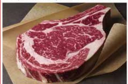
Rib Eye Steak 8490/kg kb 30 dekásak a szeletek

A leggyakrabban függesztve 1-3 fokon, 75-85%-os páratartalom érlelik. A nem ritkán 20-30 napos érlelési eljárás során a hús rengeteg vizet veszít. A hús ilyenkor elkezd belül porhanyósodni kívül szárad és színeződik, kétségtelen hogy a steakimádók elitklubjában ez a kedvenc csemegéje. Amikor elkészült a "remekmű" a külső rétegét le kell vágni róla. Ezt a tömegcsökkenést is bele kell kalkulálni az árba, ezért is számít nálunk még kifejezetten ritkaságnak. A 9-11 ezer forintos kiló ár nagyon barátinak mondható, de ha ez a hús a manapság népszerű, speciális marhákból származik, mint például a kifejezetten húshasznosításra