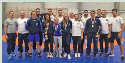
Országos bajnokságot nyertek birkózóink

Remekül szerepeltek a Sziget SC birkózói a 2020. évi felnőtt országos bajnokságon, amelyet a Kozma István Magyar Birkózó Akadémia