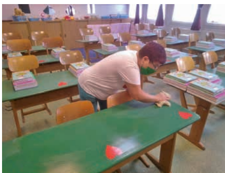
Fertőtlenítés a Szigetszentmiklói Bíró Lajos Általános Iskolában