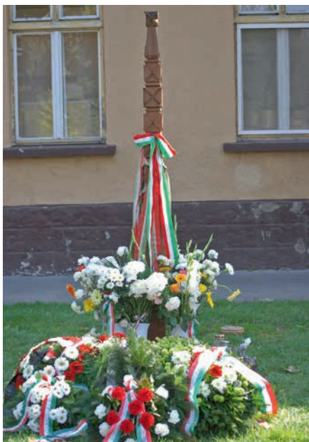
Az aradi vértanúk tiszteletére emelt kopjafa a Kossuth Lajos utcában

A 19. század elejétől népünk számos vívmányt elért a Habsburg Birodalmon belüli jogait illetően. A reformkor időszaka alatt hivatalossá vált a magyar nyelv, elindult a magyar nyelvű sajtóélet, elkezdődött a feudalizmus felszámolása, a polgári Magyarország alapjainak megteremtése. A folyamat végét a független Magyar Királyság megteremtése jelentette volna – ez, de legalábbis a Béctől való