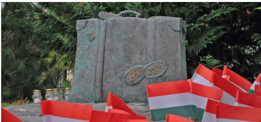
Az '56-os forradalom emlékműve a Gyergyószentmiklós téren

Az '56-os forradalom dicső pillanata volt a magyar történelemnek. A teljes magyarságot összekovácsolta, pártoktól, társadalmi rangtól függetlenül mindenki ki tudta venni részét a küzdelemben. Sokan adták életüket a harcokban, és a forradalom leverését követő megtorlások során is. Emlékezzünk hőseinkre, ápoljuk emléküket és tanuljunk tőlük!