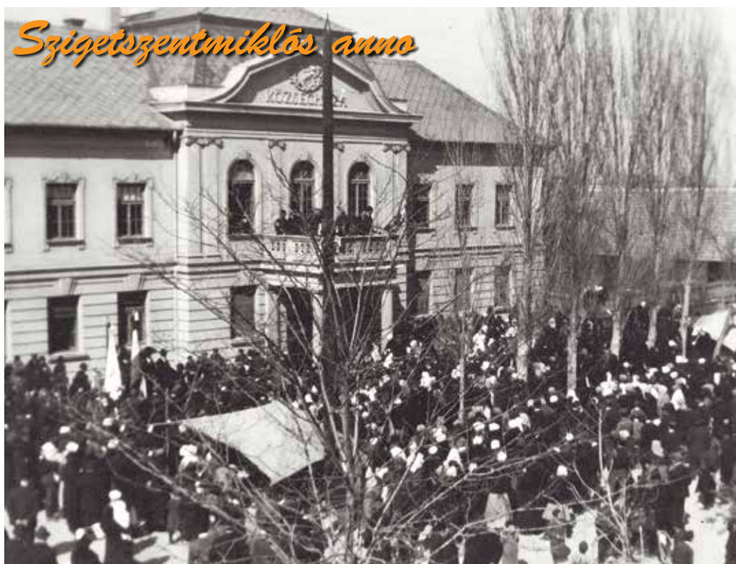
1940. március 15.