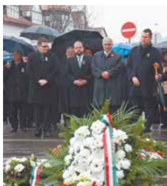
A város és a térség előljárói is megemlékeztek a szabadságharc hőseiről