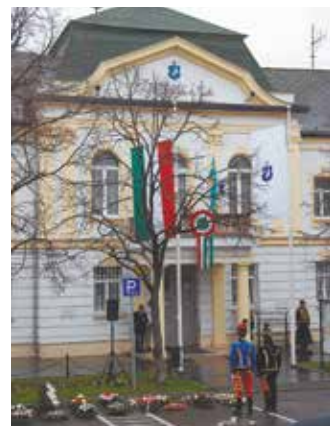
Koszorúzásra készülve Kossuth Lajos emléktáblájánál