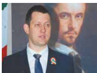
Fülöp Attila, az EMMI helyettes államtitkára mondott ünnepi beszédet