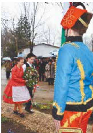
Koszorúzás a városi temetőben