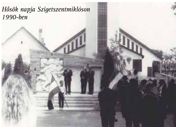
Hősök napja Szigetszentmiklóson 1990-ben

Kossuth Lajos utca keresztveződésében egyszerre vezették be a telefont, a csatornát, a vizet és a gázt. Mondani sem kell, hogy a folyamat nem kis közlekedési fennakadást okozott. Ha már itt tartunk, egy másik nagy beruházás is ekkorra datálódik: az MO-s építése. Fórum fórumot követett akkoriban a Nádasy moziban és az iskolákban. Elterjedt ugyanis,