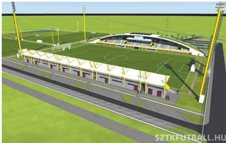
A Regionális Utánpótlás Központ látványterve

A klub fő bevételi forrása a beruházásban a társaságiadó-előlegből (tao) befolyó támogatás. Az I. ütem teljes költsége bruttó 1,062 milliárd forint. Ebből finanszírozzák a többi között a tervezést, az előkészületet, a jelenleg is zajló földmunkákat, közműépítéseket, valamint a pályák kialakítását és az utakat, parkolókat, műszaki ellenőrzést stb. – egy-