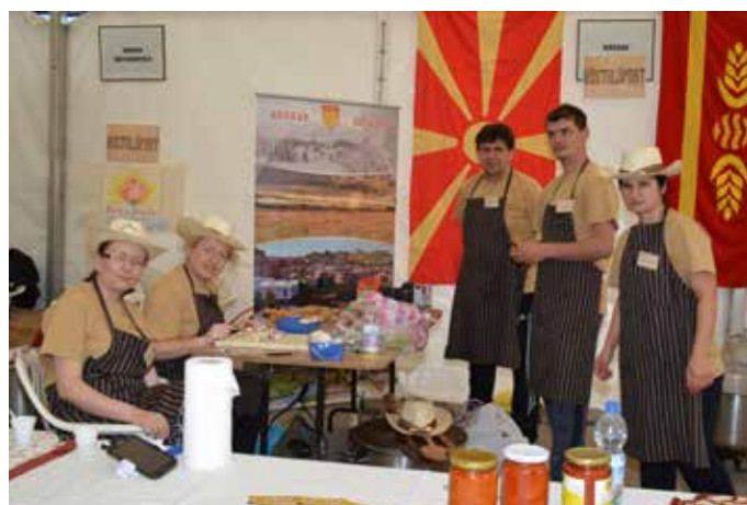
Macedón testvérvárosunk, Kocani küldöttei