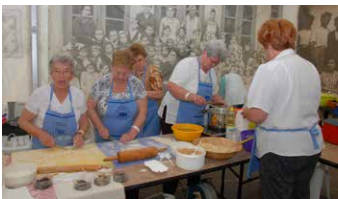
Német Nemzetiségi Klub