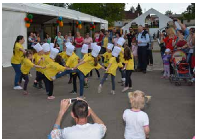
A Napraforgó Óvoda előadása