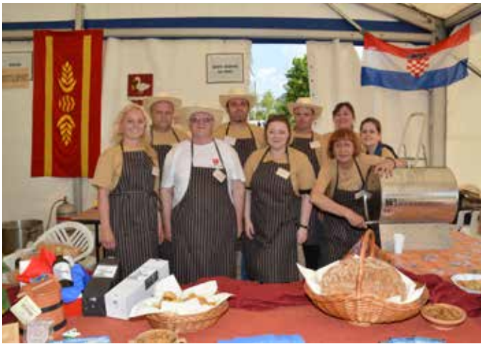
Horvát testvérvárosunk, Muraszentmárton csapata