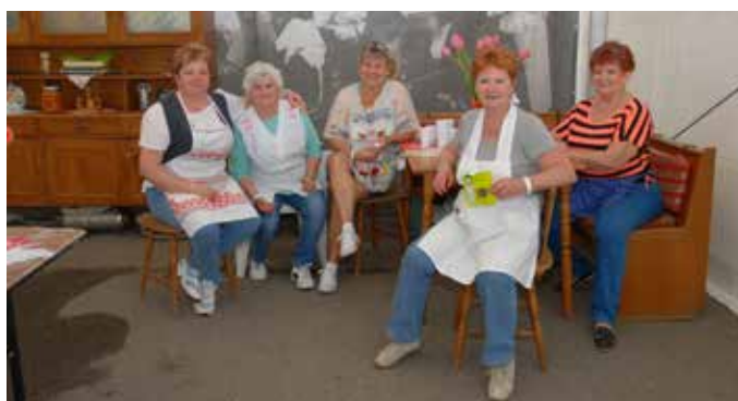
Retro sátor – Őszirózsa Nyugdíjas Klub és Kossuth Kertbarát Kör