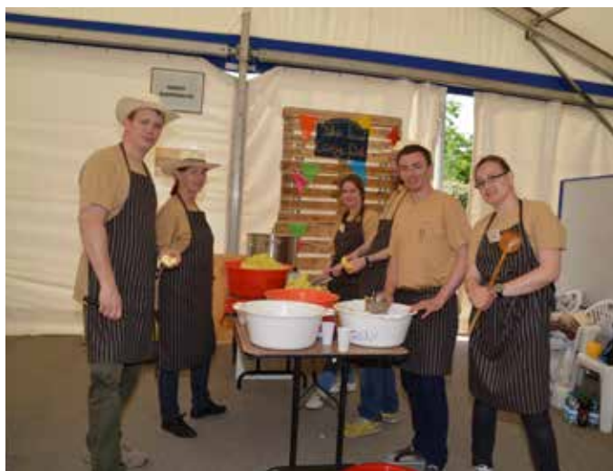
„Hazai szakácsok” (Szigetszentmiklós)