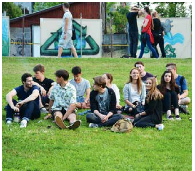
Kvízjáték a Lakihegy Rádió műsorvezetőivel