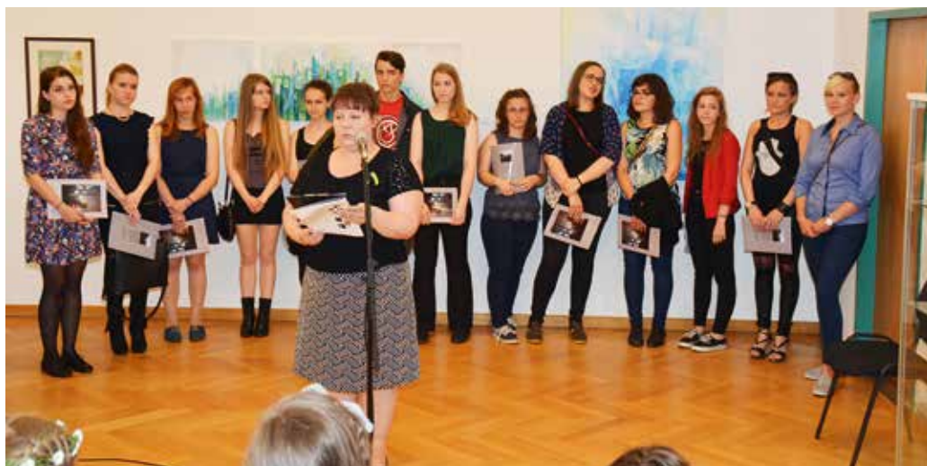
A „HELY-SZÍN” című kiállítás megnyitó ünnepsége az Aula Galériában

A Nemzeti Összetartozás Napjához kapcsolódva szervezett alkotótábort a József Attila Általános Iskola is, amelyen aktív szerepet kapott a tánc és a színjáték. Az „Öt ország, egy nemzet” elnevezésű programsorozat jegyében pedig vendégeket hívtak Erdélyből, Kárpátaljáról, Felvidékről és Délvidékről. Ők a József Attilás diákokkal közösen alkottak és vettek részt különböző eseményeken.