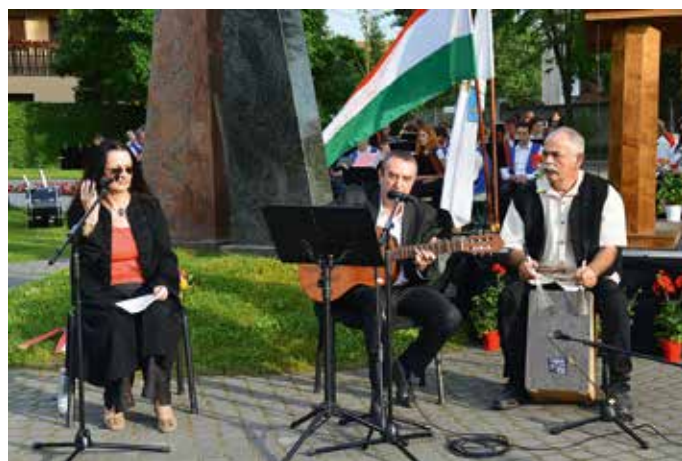
A délvidéki Mécsvirág együttes