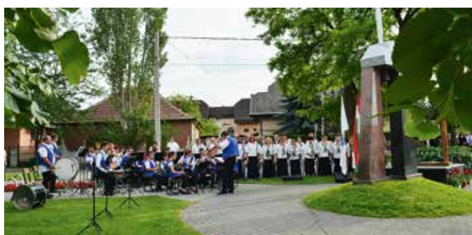
Megemlékezés az Országzászló Emlékműnél