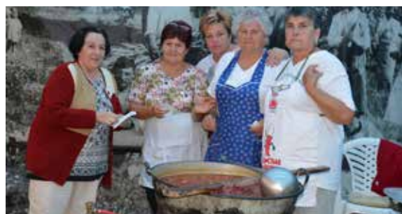
A Szabacsi Udvarban hagyományos szigetszentmiklósi ételek készültek