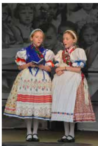
Haraszti ikrek – a Fölszállott a páva énekkategória győztesei