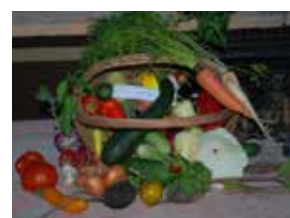
A Kossuth Kertbarát Kör őszi termésbemutatója