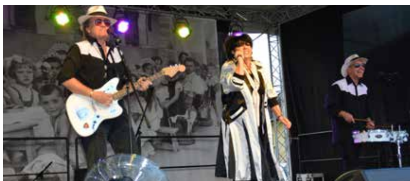
Sokak nagy kedvence, a Dolly Roll