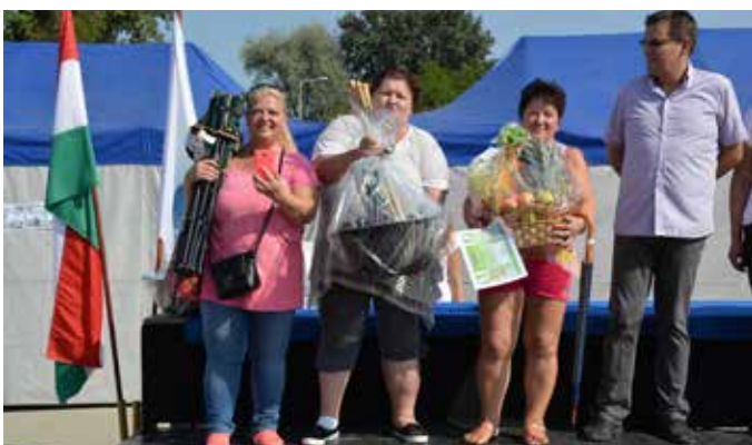
A halászléfőző verseny idei győztese a „Kishalacska” csapata