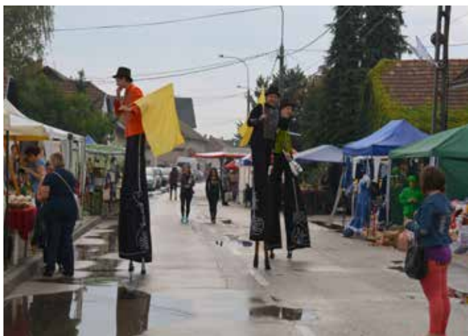
Gölylábos hívogató az Árpád utcában