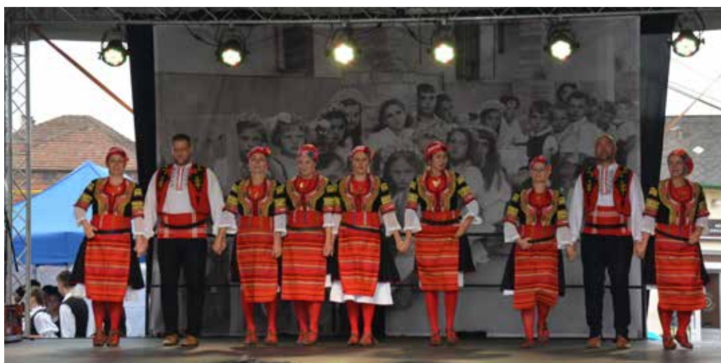
Néptánc csoportok műsora