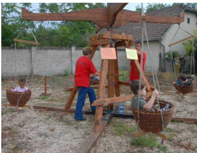
Fa körhinta a Népi Játékok Udvarában