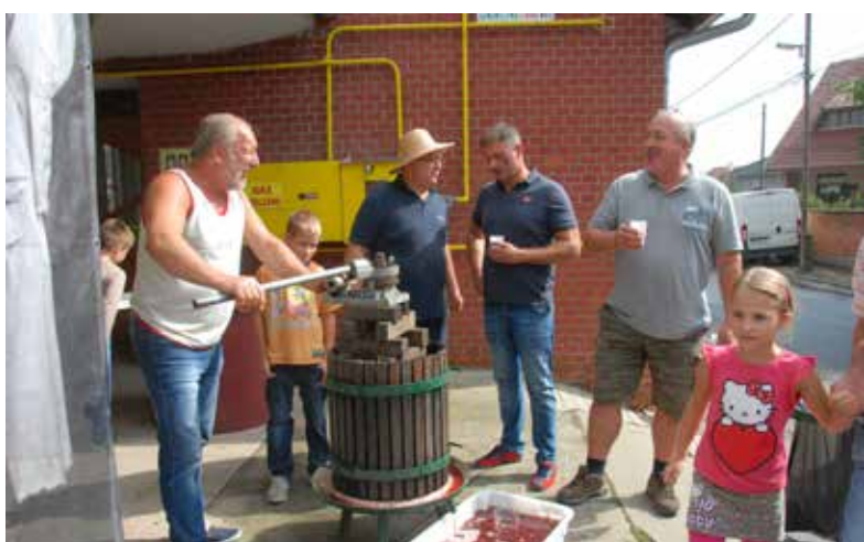
Készül a must