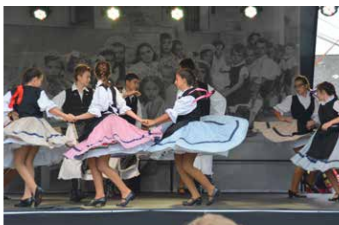
Szabacsi mustra – művészeti csoportok bemutatkozása