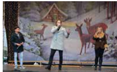
A Sziget Színház művészei