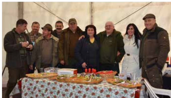
A vadásztársaság hidegtálas kóstolóval várta a korán érkezőket