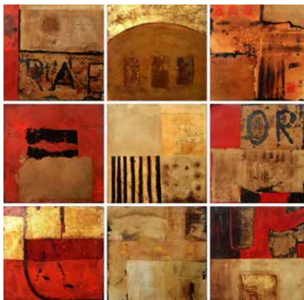
Székács Zoltán: Szülőföld