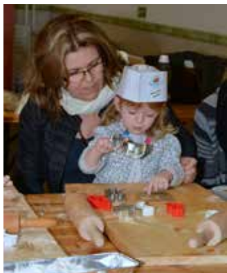
Délelőtti kézműves foglalkozás