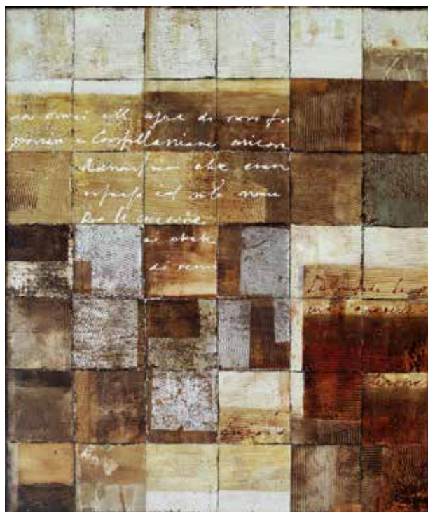
Székács Zoltán: 8. Cummunique