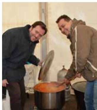
Készül a szentmiklósi töltött káposzta