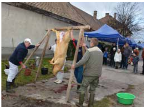
Hagyományos disznóvágás egy „áldozatkész” jószággal