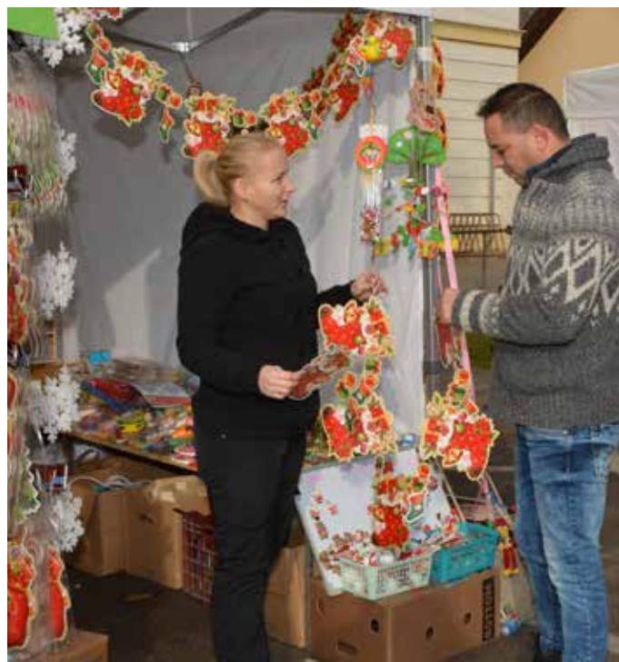
Karácsonyi kirakodóvásár a Kossuth Lajos utcában