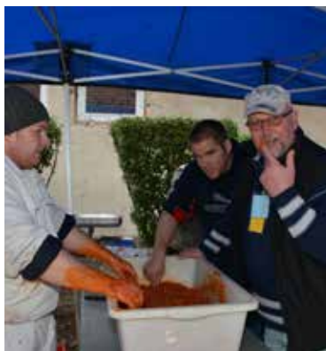
A feldolgozás örömteli pillanatai