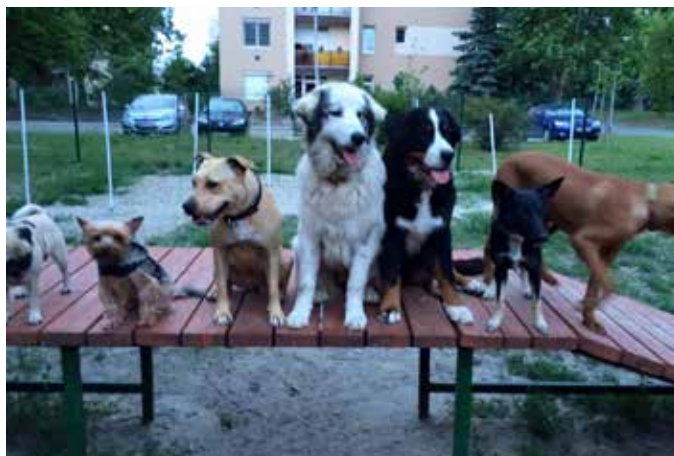
A legjobb hely a kutyafuttató a fölös energia levezetésére

Még mindig sok gondot jelentenek a megunt, kidobott kutyusok. Rendre visszatérő probléma, hogy a hanyag gazdák nem kerítik el megfelelően a kertben tartott ebeket, így azok könnyen kiszökhetnek, és az utcán csatangolva – még akár ok nélkül is – félelmet kelthetnek a járókelőkben.