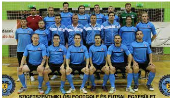
SZIGETSZENTMIKLÓSI FOOTGOLF ÉS FUTSAL EGYESÜLET

A gárda célja a stabil szereplés. Korábban már a Bajnokok Ligájában is játszott a csapat, igaz, nem a futsalban, hanem a minifutballban (ebben a szakágban 5+1-es csapatok állnak fel és nemzetközi versenyeken a kapu is nagyobb). A magyar bajnoki cím elnyerése után a maribori viadalon is részt vett az együttes, amely a 32 közé jutott a nemzetközi mezőnyben.