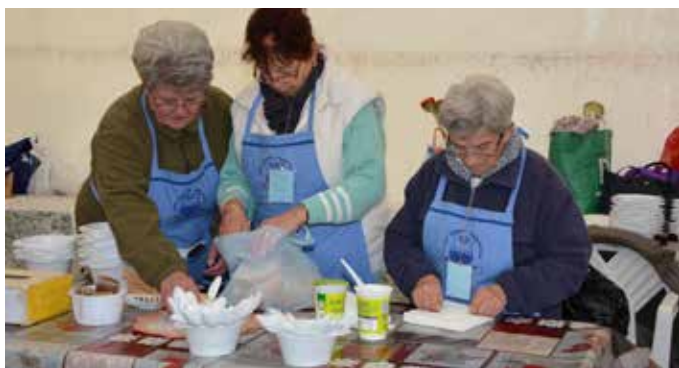
Káposztaosztás előtti készülődés