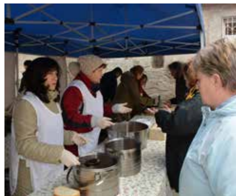
Délre elkészült a disznótoros