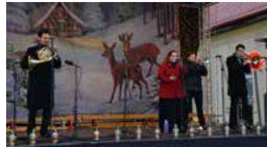
Sztárvendég a Fourtissimo zenekar