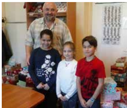
2. Weöres Sándor Általános Iskola (Tököl) – 741 diák 260 dobozt gyűjtött: 35,09%

A szigetszentmiklósi Kardos István Általános Iskola 265, a Bíró Lajos Általános Iskola 115, a Batthyány Kázmér Gimnázium 101 dobozt gyűjtött, és még a dunavarsányi Árpád Fejedelem Általános Iskolából is sok adomány érkezett. Az akció során több mint 1500 cipősdoboz gyűlt össze, melyeket az egyik helyi vállalkozó szállított el a családsegítő szolgálatokhoz. Itt döntötték