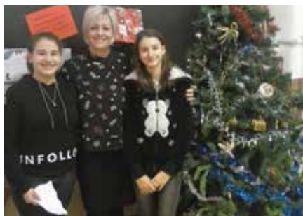
1. Hunyadi János Német Nemzetiségi Általános Iskola (Dunaharaszti) – 808 diák 294 dobozt gyűjtött: 36,39%

A Lakihegy Rádió 2016-ban is lehetőséget nyújtott a térségi diákoknak, hogy adományaikkal segítsenek a rászoruló családokon karácsonykor. A résztvevő iskolák feladata az volt, hogy cipősdobozba annyi ajándékot gyűjtsenek össze a szükségben szenvedő gyermekeknek, amennyit tudnak. Íme, a létszamarányos végeredmény: