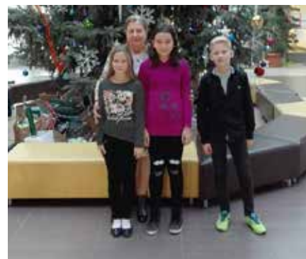
3. József Attila Általános Iskola és Alapfokú Művészeti Iskola (Szigetszentmiklós) – 1432 diák 392 dobozt gyűjtött: 27,37%

A szigetszentmiklósi Kardos István Általános Iskola 265, a Bíró Lajos Általános Iskola 115, a Batthyány Kázmér Gimnázium 101 dobozt gyűjtött, és még a dunavarsányi Árpád Fejedelem Általános Iskolából is sok adomány érkezett. Az akció során több mint 1500 cipősdoboz gyűlt össze, melyeket az egyik helyi vállalkozó szállított el a családsegítő szolgálatokhoz. Itt döntötték