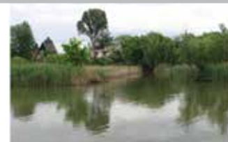
Tisztább lesz a Kis-Duna vize

A kivitelezést elnyerő PSZ RSD Konzorcium több mint 300 kilométernyi csatornát épít ki egy év alatt. A 14 településen eddig összesen 26 524 fm-ből 8870 fm gravitációs gerinc- és bekötővezetékét fektették le a szakemberek. 294 719 fm-ből 144 626 fm nyomott gerinc- és bekötővezetékét építették, 7100 db házi átemelőtartályból 4352 db-ot süllyesztettek a földbe, valamint a 23 darab házi átemelőakna földbe