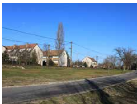
A Kéktó és a Jegenye utca találkozása, ahol egykor a nagy domb húzódott