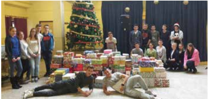
Gyűlnek a dobozok

A cél az olyan hátrányos helyzetű családok támogatása volt, akiknek az ünnepek alatt is nélkülözniük kell.