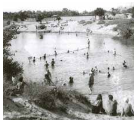
Fürdőzők 1948 körül

így a jelenlegi színpad területénél akarta átvezetni a csatornát a Dunához. Az volt a terve, hogy a tóból annyi vizet szivattyúz ki, amennyit tud, s mivel nagyon közel volt a Duna, az alulról szivárgó víz segítségével tartja a szintet. Ez a folyamat akár egy éjszaka alatt is lezajlott volna. A tó mellett hintázhattak a gyerekek, a jelenlegi petanque-pálya területén pedig kabinsor állt, ahol át lehetett öltözni. A Kéktó és a Jegenye utca találkozásánál lévő bejáratnál Tárnok egy emeletes kisházat is építtetett, melynek emelete szállóként, az alsó szint pedig vendégfogadóként funkcionált. Az épületnek volt egy nagy terasza is, ahol zenészek muzsikáltak. Mivel Tárnok tapasztalt üzletember volt, joggal merül fel a kérdés, hogy miért nem kért belépőt a fürdőzőktől. Nyilván ez volt a szándéka, azonban a fejlesztéseket idő előtt be kellett fejeznie, ugyanis a Kéktót is elérte az államosítás. Az elvtársak próbálták karbantartani a tavat, amely bizony hínárosodni kezdett. Gondolták, majd kotrógéppel megoldják a problémát, de ahogy egy fanyar humorú vígjátékban is történné: nem boldogultak vele. Döntés született: olcsóbb lesz, ha betemetik. Hamar híre ment ennek a városban, a lakosság pedig sajnálta a mindenki által kedvelt tavat, melyhez oly sok kedves emléke fűződött. Azzal vigasztalták az embereket, hogy majd szép, új épületeket kapnak helyette.