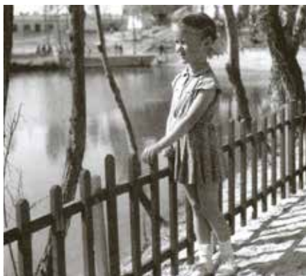
Díszlécekkel körülkerített tó