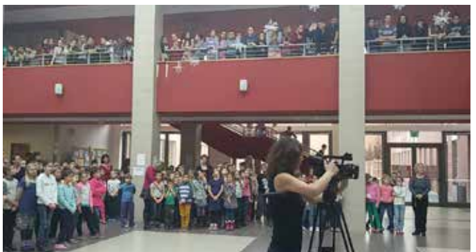
A vándorkupa ünnepélyes átadója a József Attila Általános Iskola és Alapfokú Művészeti Iskolában