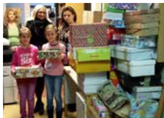
Volt, ahol már alig fértek el az ajándékok