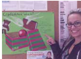
Egy tanuló által készített figyelemfelhívó plakát