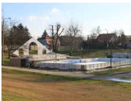
Az ideiglenes jégpálya 2014-ben