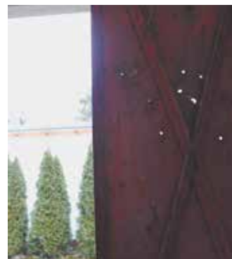
A pinceajtó is több helyen őrzi a gépfegyver nyomait, mely befelé szakította a nehéz vasajtót