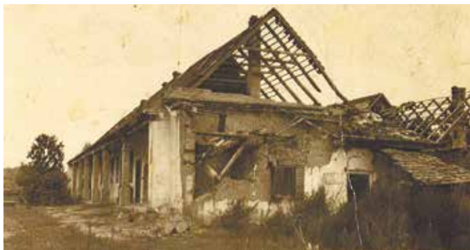
A leégett épület a Petőfi utca 45. szám alatt