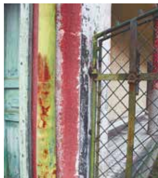
A házon a mai napig láthatók a háborús nyomok, például az a kátrányfolt, amit a lángszóró okozott

A fejlődésnek azonban megálljt parancsolt a II. világháború. Volt, amikor a Lakihegy felől érkező német csapatok összecsaptak a Bercsényi utca felől érkező oroszokkal. A szintén Lakihegy felé visszavonuló