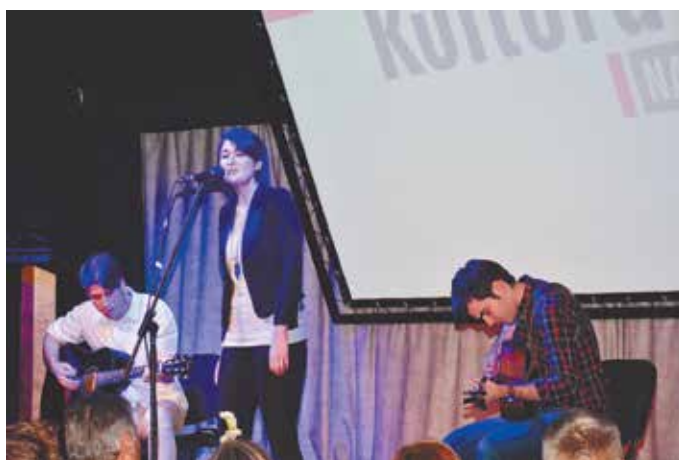
Az NKA Cseh Tamás Programjának díjazott zenekara, a Margaret Island