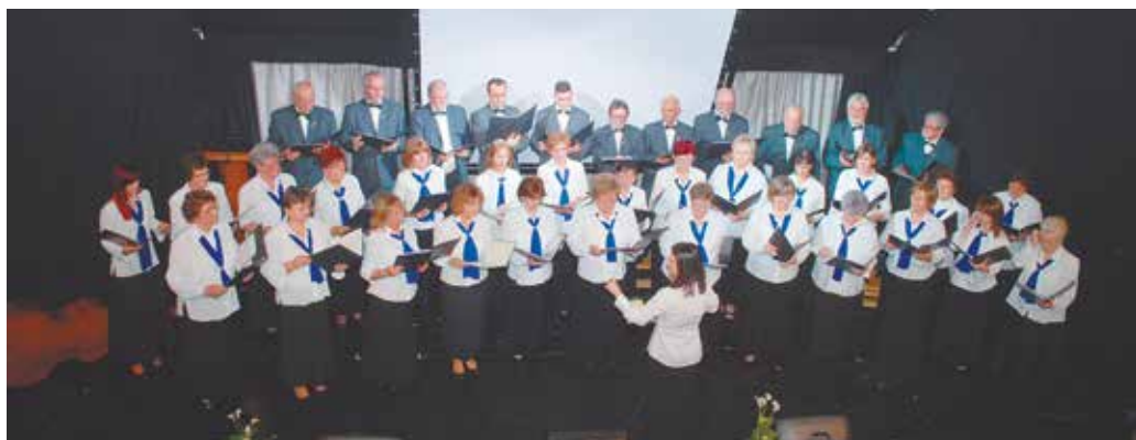
Székely Miklós Városi Kórus