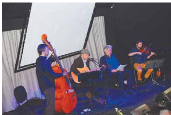
A Vodku Fiai nevű együttes Cseh Tamás-estje