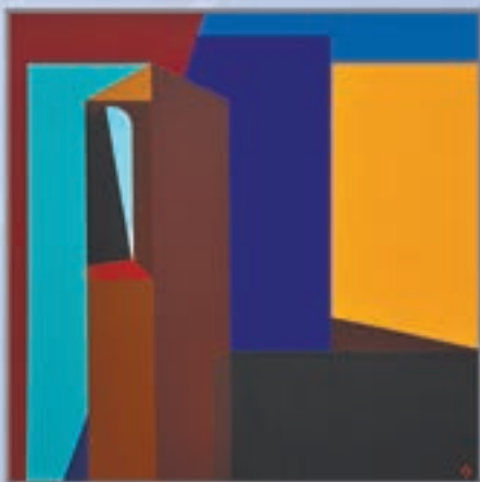
Emlék (60x60, akril, vászon)