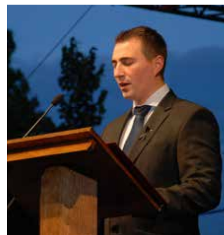
Ünnepi beszédet mond Borbély Lénárd, Csepel polgármestere