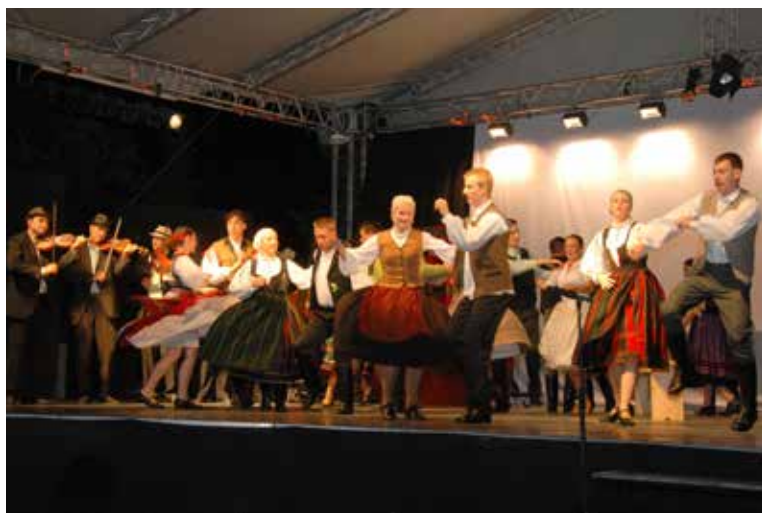
Színpadon a sepsiszentgyörgyi Háromszék Táncgyűttes