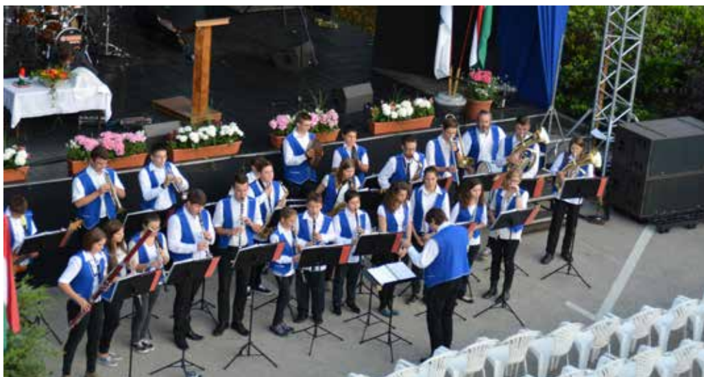
Az Ádám Jenő Zeneiskola Fúvószenekara