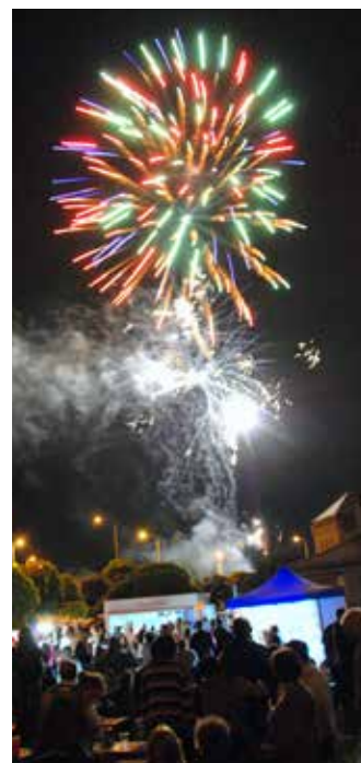
Az ünnep záróakkordja az elmaradhatatlan tűzijáték