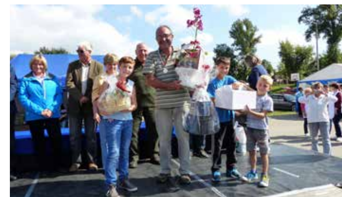
A 2. helyezett csapat