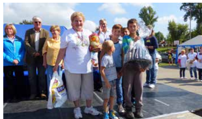
A 3. helyezett csapat