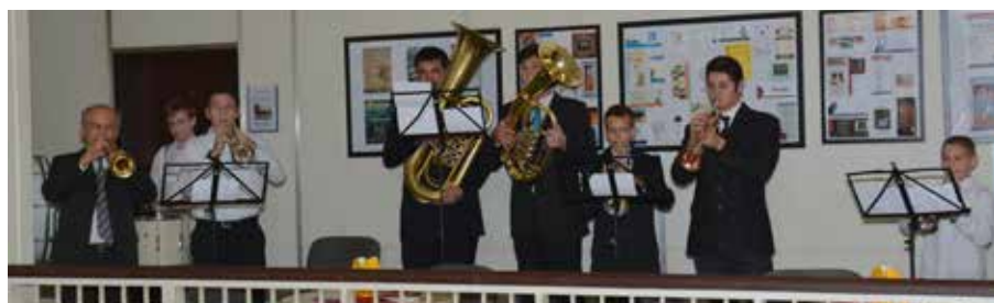
Isten éltesse a 25 éves intézményt, annak valamennyi munkatársát és látogatóját!