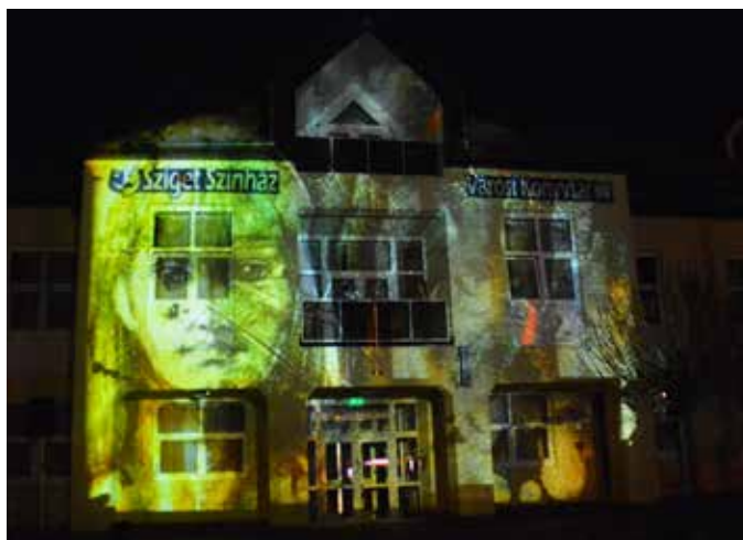
Szín pompás fényfestéssel vette kezdetét az ünnepi hét eseménysorozata