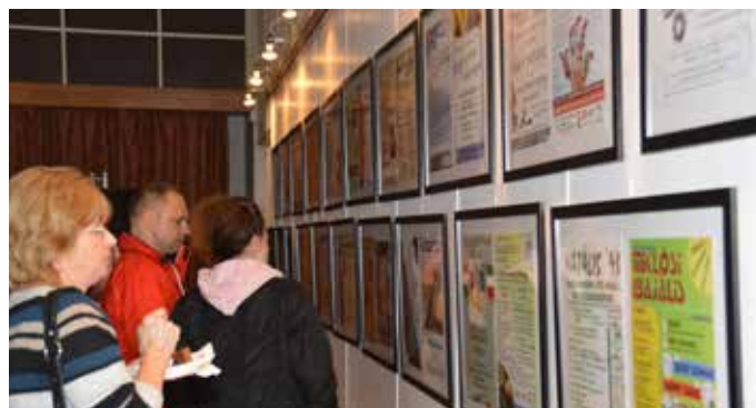
Csukay Zoltán munkáiból nyílt plakátkiállítás az Aula Galériában